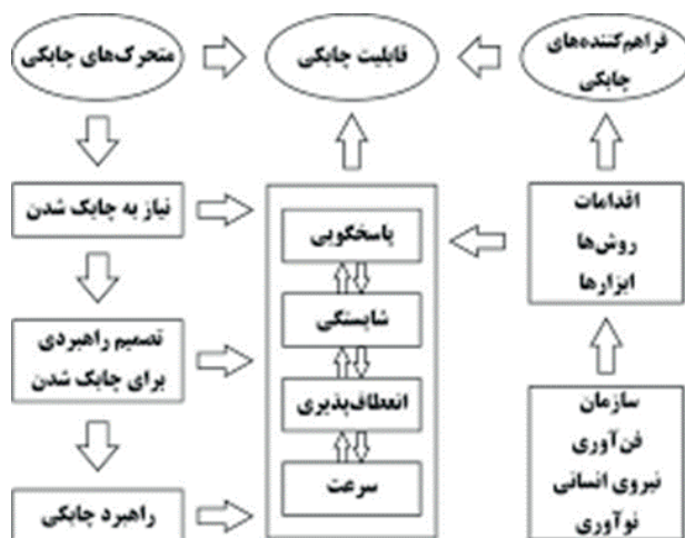
شکل ۱. مدل دستیابی به چابکی سازمان (شریفی و ژانگ، ۲۰۰۰: ۱۱)