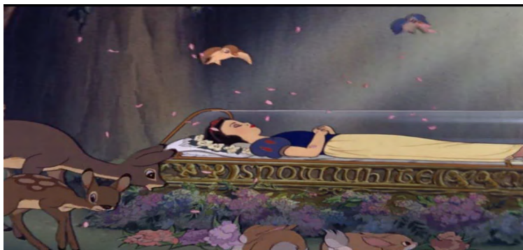
تصویرا. بیداری سفید برفی در انیمیشن سفید برفی وهفت کوتوله