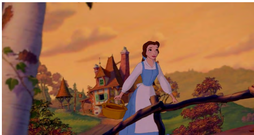
تصویر ۳. معرفی بل

زن در این داستان پر قدرت، کنشگر، دگرگون کننده، مهربان و در عین حال جبار و انتخابگر است. حضور او یا آگزیزتانس ۱ او سبب شدن ۲ و صیوروت ۳ شخصیت مرد می‌شود. با توجه به آرای هگل ۳ ، میخایل باختین ۴ ، مکتب کنش‌گرایان نمادین ۵ و اعضای آن مانند هربرت مید ۶ و هربرت بلومر ۷ ، حضور دیگری سبب ساخت شدن خود ۸ می‌شود. همچنین به باور ژاک لکان ۹ ، دیگری بزرگ (Other) هم در شخصیت و هم در نظام نمادین زبانی تأثیر دارد. در این داستان حضور زن به عنوان دیگری هم در زبان شاهزاده و هم در شخصیت او تأثیر می‌گذارد، که می‌توان تأثیر و ارتباط دوسویه بدن و تن را مشاهده کرد (ریترز، ۲۰۱۱؛ جانستون، ۲۰۱۳).