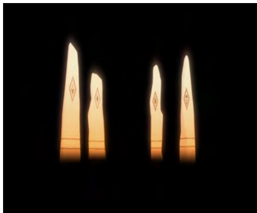
تصویر ۶. ارواح چهارگانه جنگل در یخزده ۲

دیزنی با بازنمایی این اقوام در جهان مدرن و خصوصا نشان دادن این اقوام با زبان انگلیسی و کالایی شدن فرهنگ، طبق نظر گرامشی و هابرماس به هژمونی و استعمار زیست-جهان این فرهنگ‌ها می‌پردازد (ریترز ۲۰۱۱).