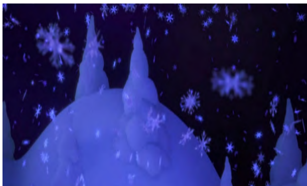
تصویر ۵. نمایش زیبایی برف و یخ در انیمیشن یخ‌زده ۲