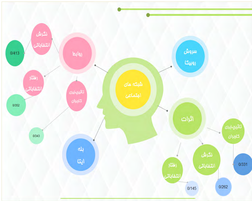
شکل ۲- مدل تجربی اثرات شبکه‌های اجتماعی داخلی بر مشارکت سیاسی در نواحی روستایی

برای تفهیم مناسب نتایج تحقیق نیز نتایج روابط و اثرات ابعاد موردبررسی تحقیق بر مشارکت سیاسی، مدل تجربی نتایج تحقیق به صورت شکل (۲) بیان می‌گردد.