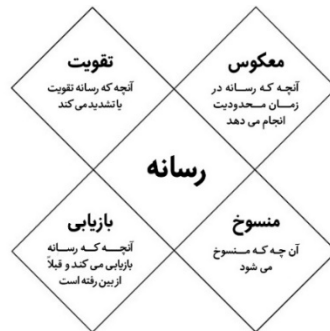
تتراد مک لوهان مک لوهان (۱۹۸۸)

می‌کرد؛ شیوه‌ای که ون لون ۱ (۲۰۰۸) آن را «شگرد» مک لوهان می‌نامد. خود مک لوهان به این کارش تتراد ۲ می‌گوید (Loon, 2008). تتراد ابزار یا روشی برای بررسی اثرات هر فناوری و رسانه‌ای بر جامعه، همراه با تقسیم تأثیرات آن رسانه، به چهار دسته و نمایش همزمان آنهاست. (Thomas, 2007). به این ترتیب، مک لوهان، تتراد را به عنوان یک ابزار آموزشی طراحی کرد و قوانین خود را به عنوان سؤالاتی مطرح کرد که بتوانیم با آن، هر رسانه‌ای را مورد بررسی قرار دهیم: «رسانه چه چیزی را تقویت می‌کند؟ رسانه چه چیزی را منسوخ می‌کند؟ رسانه چه چیزی را که قبلاً منسوخ شده بود، بازیابی می‌کند؟ وقتی رسانه به افراط کشیده می‌شود، چه چیزی را معکوس می‌کند؟». مک لوهان در کارش این چهار سؤال را به عنوان چهار عامل تعیین‌کننده جایگاه و نقش یک رسانه، در زندگی انسان‌ها اعمال می‌کند. بدیهی است کسی که معتقد است پاسخ به این چهار سؤال به آشکار شدن یک رسانه در جامعه منجر می‌شود، بدون شک به محیط و زمینه‌های ظهور یک رسانه هم توجه دارد (Couldry, 2012). از نظر بصری، یک تتراد به صورت چهار الماس که X را تشکیل می‌دهند، نشان داده می‌شود (تصویر ۱) و نام یک رسانه که در مرکز آن وجود دارد. دو الماس در سمت چپ یک تتراد، ویژگی‌های افزایش و تقویت و بازیابی رسانه هستند. دو الماس در سمت راست یک تتراد عبارت‌اند از ویژگی‌های منسوخ و معکوس شدن (McLuhan, 1998: 28).