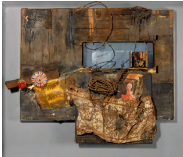
تصویر ۳- ولف ووستل، چشم‌انداز آلمانی، ۱۹۵۹ (URL: 3)

پایک و ووستل پخش برنامه‌های تلویزیونی را با ایجاد اختلال مغناطیسی در تصاویر، تغییر داده و تحریف کردند. با این حال، استفاده از دستگاه‌های تلویزیون بدون ضبط کردن تصاویر نیز بخشی از هنر ویدیویی است که از همان آغاز مدنظر بود. در واقع، توجه و علاقه به تلویزیون صرفاً به دلیل فناوری جدید تصویری در دستیابی به اشکال مختلف فرهنگی و اطلاعاتی نبود، بلکه تلویزیون یک شیء