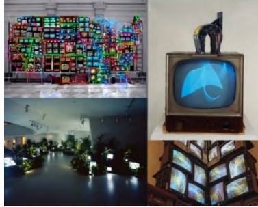
تصویر ۲- آثار نام جون پایک (URL: 2)

جایگاه شایسته خود را از سوی یک هنرمند یافته است (راش، ۱۳۸۹: ۱۰۴). در این دوران، تلویزیون به عنوان یک شیء آماده، هم در معرض تحقیقات زیبایی‌شناسی قرار می‌گیرد و هم به عنوان وسیله‌ای برای نمایش تصاویر متحرک و بیان مفاهیم استفاده می‌شود. تولید چندین مقاله و تعدادی نمایش و اثر، گواه بر تمرکز بر مفهوم و تأثیر فرهنگی تلویزیون است (Hayden, 2016: 21).