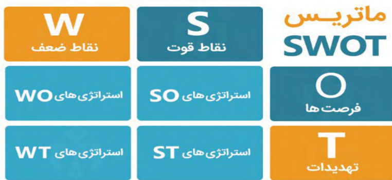
شکل ۱- ماتریس تحلیلی سوات

SWOT سرواژه عبارات قوت‌ها (Strengths)، ضعف‌ها (Weaknesses)، فرصت‌ها (Opportunities) و تهدیدات (Threats) است (احمدی و دیگران، ۱۳۹۰: ۶۵). ماتریس تحلیلی سوات که ترکیبی از چهار عنصر قوت، ضعف، فرصت و تهدید است دارای چهار خروجی با عنوان راهبردهای چهارگانه است. راهبردهای قوت - فرصت (SO)، قوت - تهدید (ST)، ضعف - فرصت (WO) و نقاط ضعف - تهدید (WT).